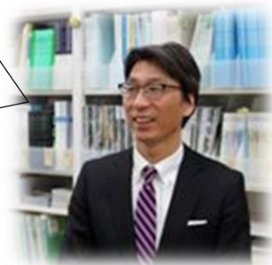
奈良教育大学教授 びわこ成蹊スポーツ大学教授 現在、大阪経済大学教授

◎滋賀県立膳所高校、筑波大学を卒業し、筑波大学大学院を修了。東京大学博士（教育学）。スポーツ歴として、1984年ロサンゼルスオリンピック水球競技出場。国民体育大会30歳以上50m自由形二連覇。 ◎スポーツバイオメカニクス、高地トレーニング、スポーツ学のすすめ等 研究テーマの一つとして、脳の発達が著しい就学前教育幼児また低学年児童を対象とした運動プログラムの開発がある。近年、『運動が脳を育てる』といった研究成果が多く発表されており、その実践的な運動プログラムの開発に取り組んでいる。