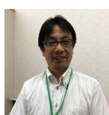
大垣先生 塾講師 会社員